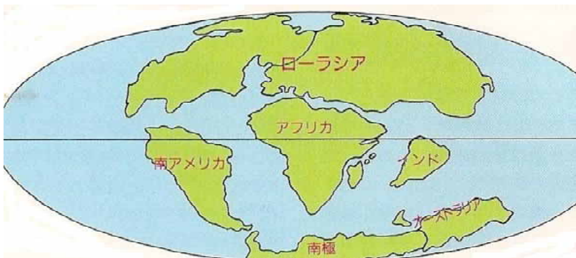
約7000年前（白亜紀の終わり頃）の世界 太平洋の南部が広がり、地中海が形成されはじめ。 やがてインドプレ-トがロ-ラシア大陸（ユ-ラシア大陸）と衝突、潜り込む。